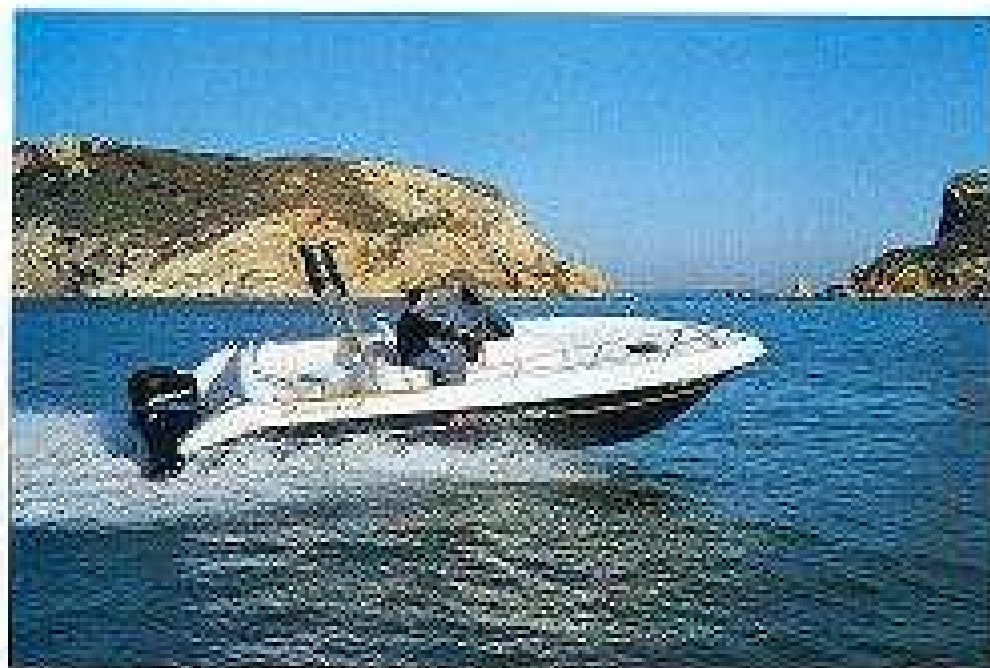
Las líneas de casco permiten una rápida aceleración.