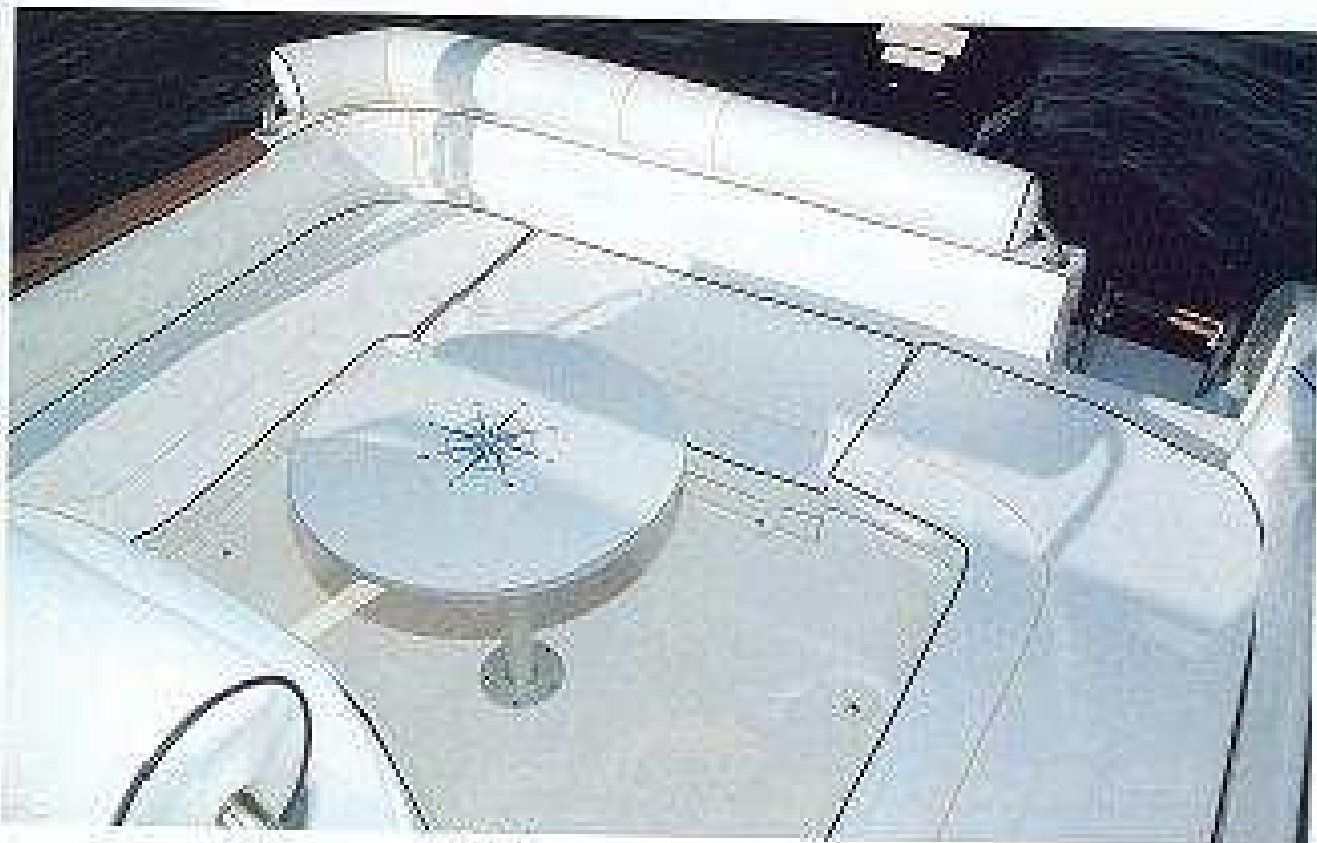
La bañera cuenta con una moca central.

El asiento en "U" de la bañera rodea una moca que se puede quitar con una fácil maniobra, lográndose así una superficie más cómoda. Una toldilla de fácil aplicación cubre toda la zona de bañera y el puesto de mando, lo cual será muy de agradecer en las largas jornadas estivales. En la popa, una prebanera evitará salpicaduras indeseadas en el interior y sobre el lado de babor presenta una escalera de baño y un pasamanos que facilitará el acceso desde el agua.