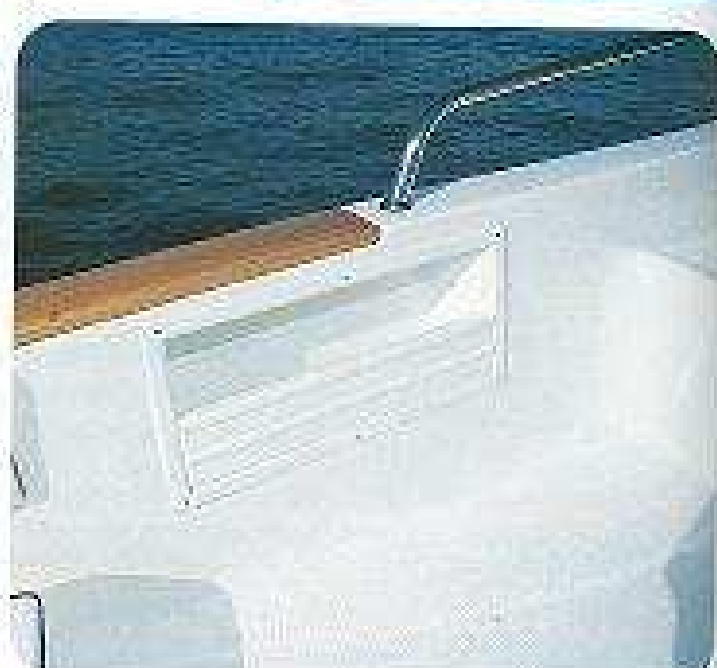
Hay cuarteros laterales en ambas bandas.