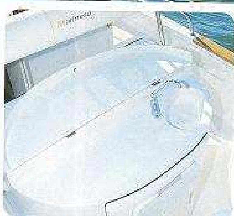
El asiento del patrón incluye una nevera y el fregadero.