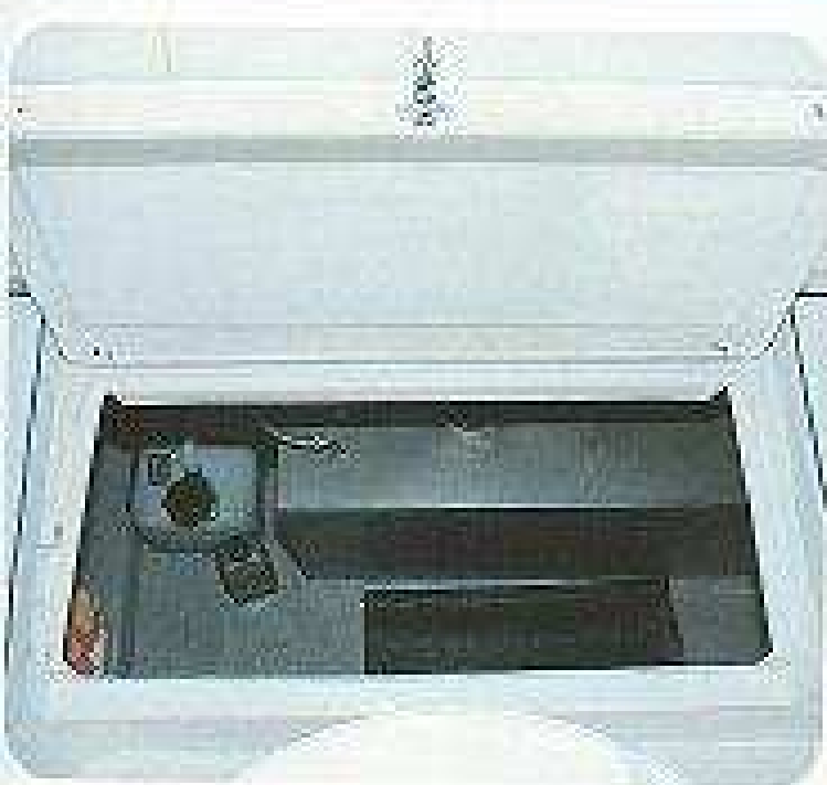
Bajo los asientos de popa hay un gran volumen de estiba.