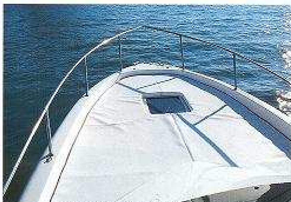
El solrium de proa sólo se interrumpe por un portillo practicable.

Junto a la puerta de la cabina se encuentra el puesto de mando, que cuenta con un panel eléctrico y otro para instrumentación; los mandos del motor se encuentran a la derecha del volante. El conjunto logra una condición ergonómica, de buena visibilidad, y el parabrisas protege correctamente el área. El asiento del patrón incluye un respaldo que varía su posición, dado que el