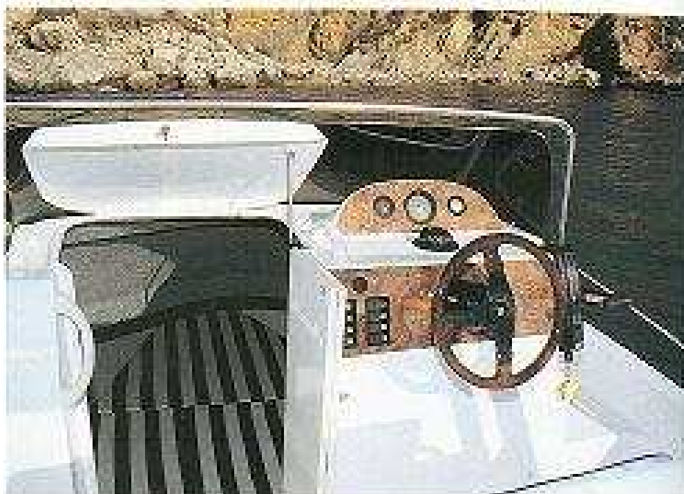
El acceso a la cabina se hace por una puerta que dispone de abertura superior.

asiento está integrado con un mueble que presenta una encimera y un fregadero y, debajo, espacio para instalar una nevera. Debajo de todos los asientos de la cabina se desarrollan cofres de estiba para la estiba de las diferentes artes de pesca y utensilios varios. También dispone de guanteras en las bandas para tener al alcance los objetos de mayor utilidad.