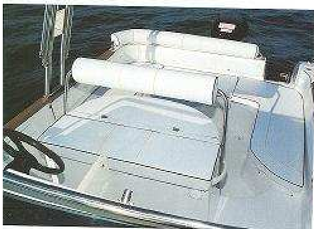
El asiento del patrón tiene un respaldo abatible.

El parabrisas protege correctamente el puesto de mando.