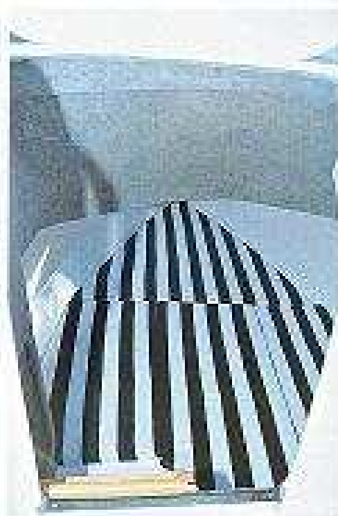
La cabina es una gran superficie acolchada.

velocidad punta de 37,6 nudos y una velocidad crucero rápida de 25 nudos a 3000 rpm. Es notable su baja velocidad al ralentí, que con 800 rpm desarrolla sólo 2,8 nudos. En la prueba de aceleración, logró el planeo en tan sólo cuatro segundos y la velocidad crucero, en quince. © Textos y fotos: Diego Traves